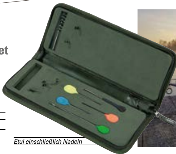
Etui einschließlich Nadeln