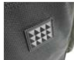
Gegen Verschleiß – Reißfeste Scheuerpads am Taschenboden.