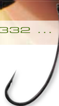
TURN DOWN BOILIE HOOK