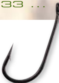
D-RIG BOILIE HOOK