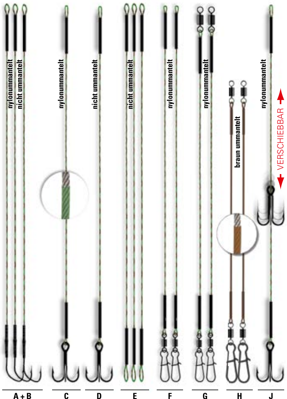
A + B