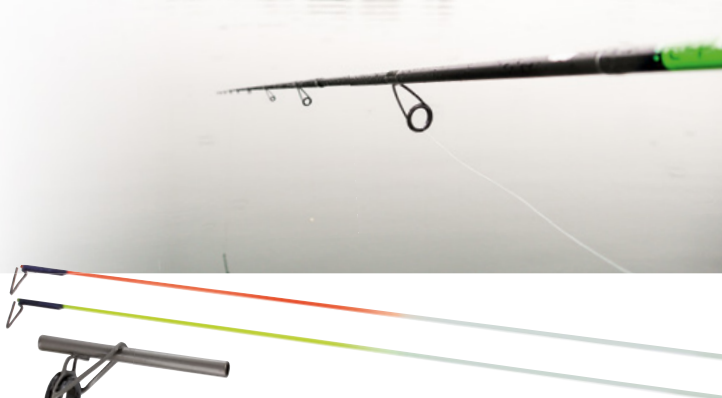
8356 002 Universal Surf Nachrüst-Set Funktion: Zur optimalen Bisserkennung – ähnlich einer Feder-Rute. Passend für viele Brandungsruten. 2 Spitzenteile + Ring (Ø 4,5 mm)