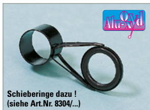
Schieberinge dazu! (siehe Art.Nr. 8304/...)